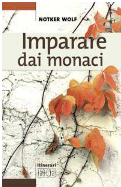
NOTKER WOLF, Imparare dai monaci, EDB, Bologna 2013

Mi sono imbattuto in questo testo per errore, infatti il mio intento era comprare un altro libro, ma per un disguido mi sono trovato tra le mani il libro dell'abate primate dell'ordine dei Benedettini. Lo stile accattivante dell'autore e gli argomenti trattati mi hanno catturato e per una volta ho benedetto uno sbaglio. È un testo di spiritualità che attingendo a piene mani dalla sapienza della Regola di San Benedetto aiuta ad affrontare il rapporto col tempo, la preghiera, il lavoro, la creazione, l'arte, ecc