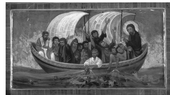
Lui nella nostra barca (Lc 5.1-11)

(Card. Tettamanzi, Lettera agli sposi in situazione di separazione, divorzio e nuova unione)