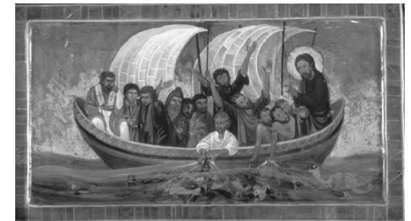
Lui nella nostra barca (Lc 5,1-11)

(Card. Tettamanzi, Lettera agli sposi in situazione di separazione, divorzio e nuova unione)