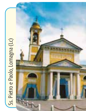
Ss. Pietro e Paolo, Lomagna (Lc)