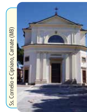
Ss. Cornelio e Cipriano, Camate (MI)

Via B. Crespi, 30 - 20159 Milano - Tel. 02.345608.1 - Fax 02.345608.36 - Distr. Libreria Ancora Via Larga, 7 - 20122 Milano - Tel. 02.5830.7006 - abbonamenti@ancoralibri.it LA MESSA FESTIVA DEI FEDELI - Settimanale liturgico - N. 21 - Anno 35 - Direttore Responsabile G. Zini - Trib. Milano n. 344 del 6-7-1985 - Prezzo € 0,041 - Stampato su carta riciclata. Imprimatur: in Curia Arch. Mediolani die 4-11-2019, B. Marinoni Vic. ep.