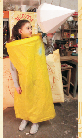
UN ALTRO MODELLO