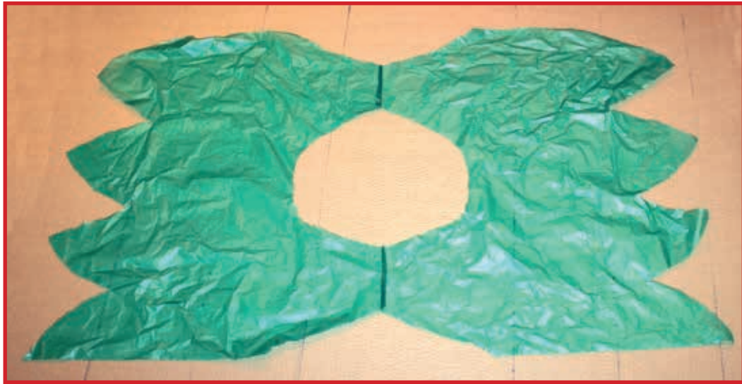
POSSIBILE COLLETTO CON PLASTICA LEGGERA (TIPO SACCO DELLA SPAZZATURA)