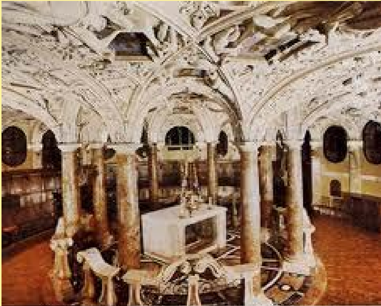
Milano - Duomo - La cripta o coro female (XVI-XVII sec.)