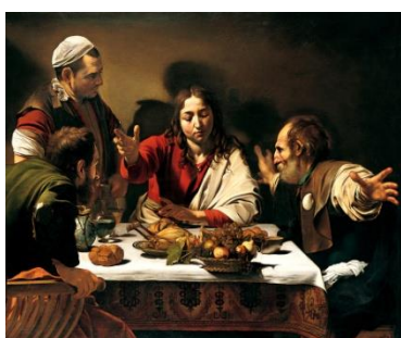
Cena di Emmaus del Caravaggio (National Gallery di Londra)