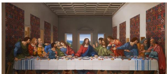
Ultima Cena di Leonardo (Santa Maria delle Grazie – Milano)

Dopo aver fatto osservare l'immagine e letto il testo evangelico, si può fare questa domanda ai ragazzi: