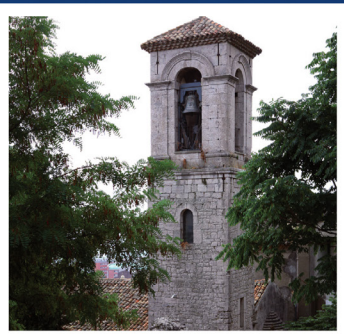
Ore 8.30 S. Messa del Patrono

Per i Parroci che hanno necessità di comandare il suono delle campane di più Chiese Parrocchiali di loro competenza: con il QUADRO COMANDO DE ANTONI oggi è possibile e facile! Basta un collegamento ad internet.