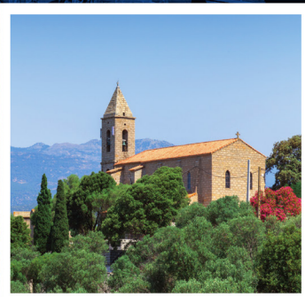
Ore 10.30 Liturgia Domenicale