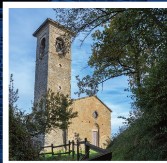
Ore 11.30 Celebrazione del Sacro Matrimonio